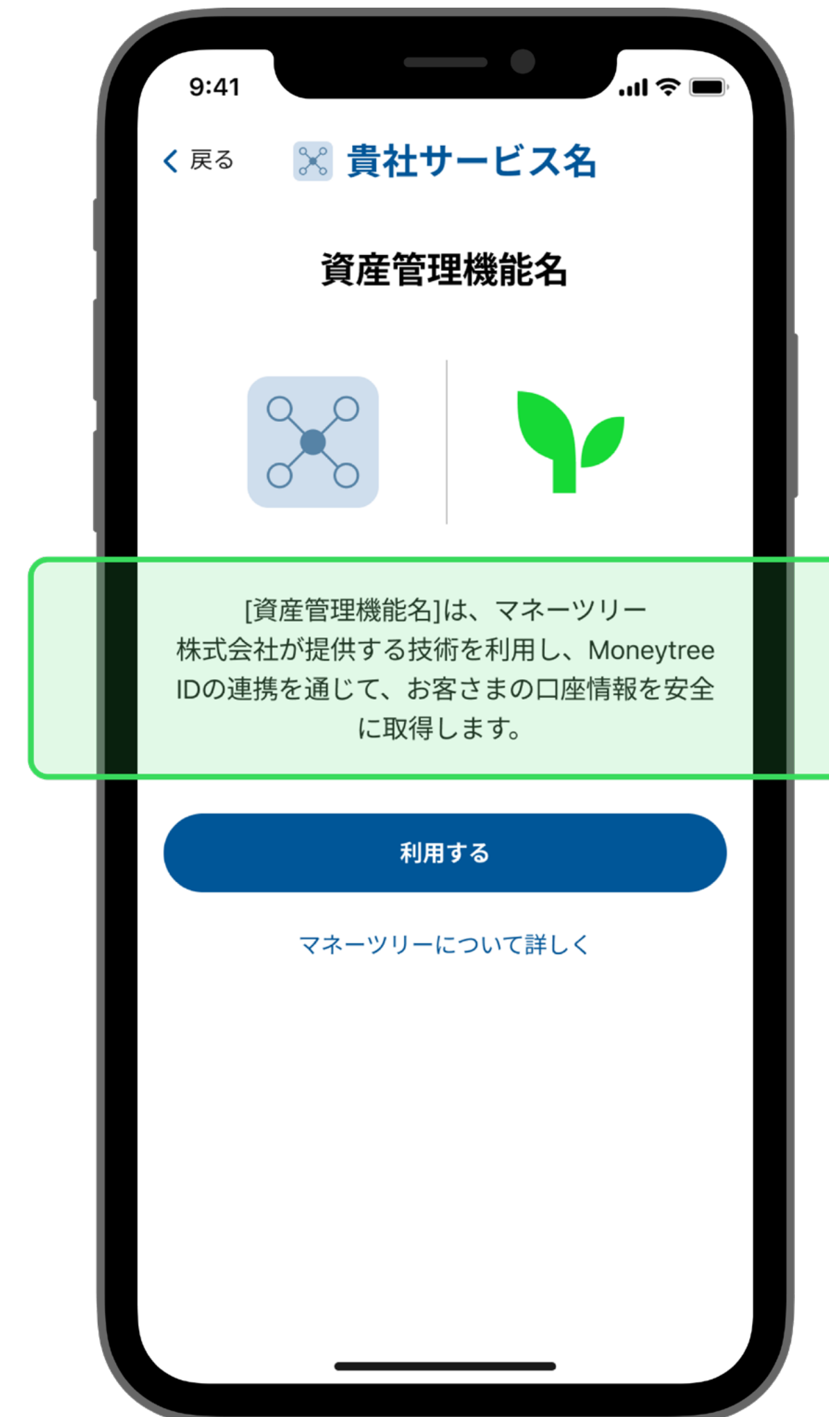
Moneytree IDの連携に関する説明文