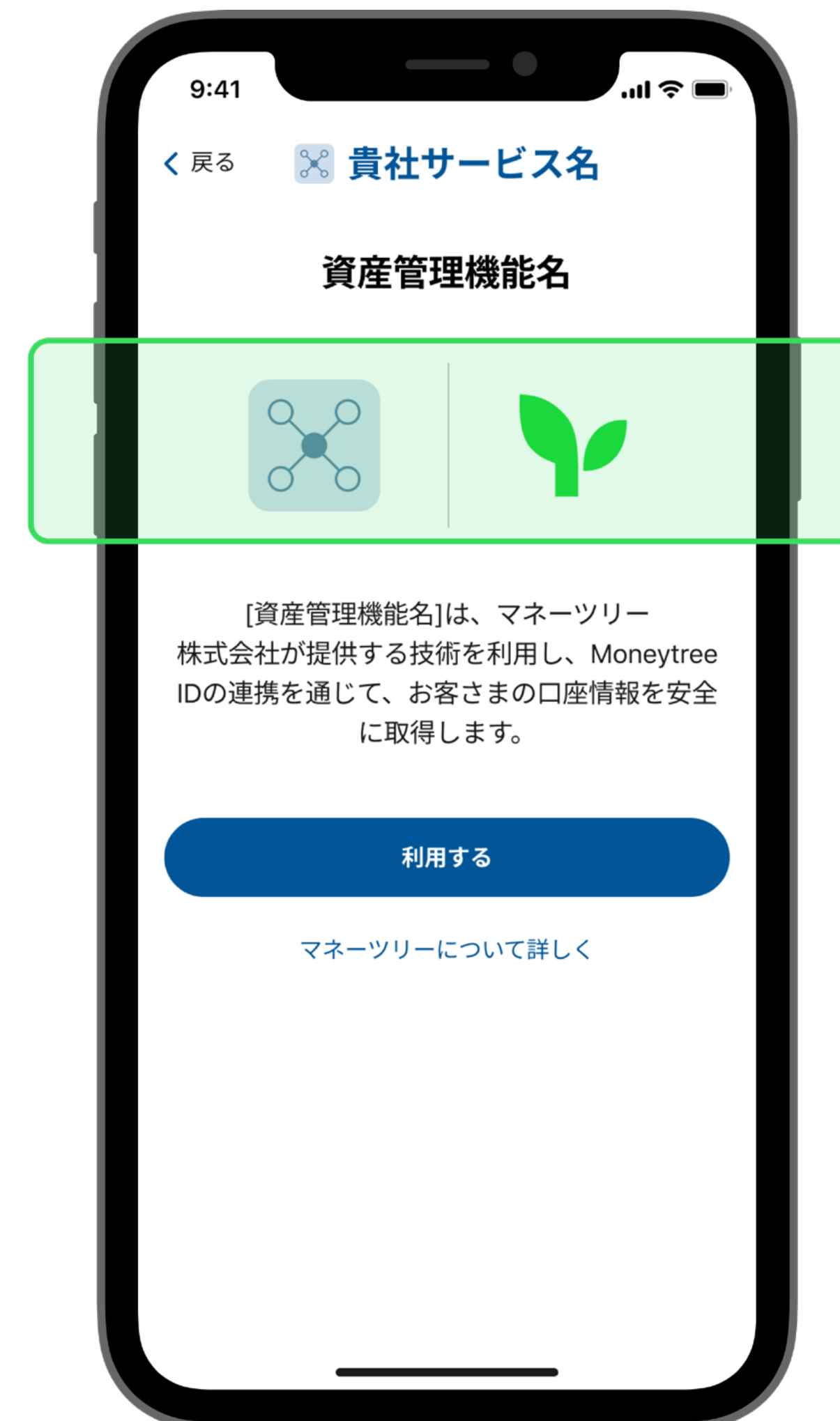
提携関係を示す両社のロゴ

※マネーツリーのロゴは、当社のブランドガイドラインに沿ってご使用ください。 (ブランドページは こちら )