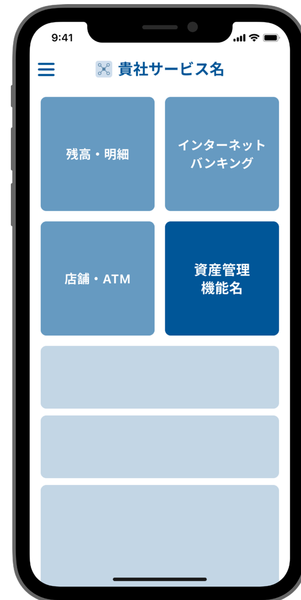
ナビゲーション画面の例